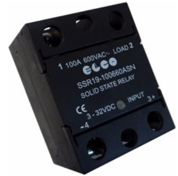
SSR19 - 80/100/125 A